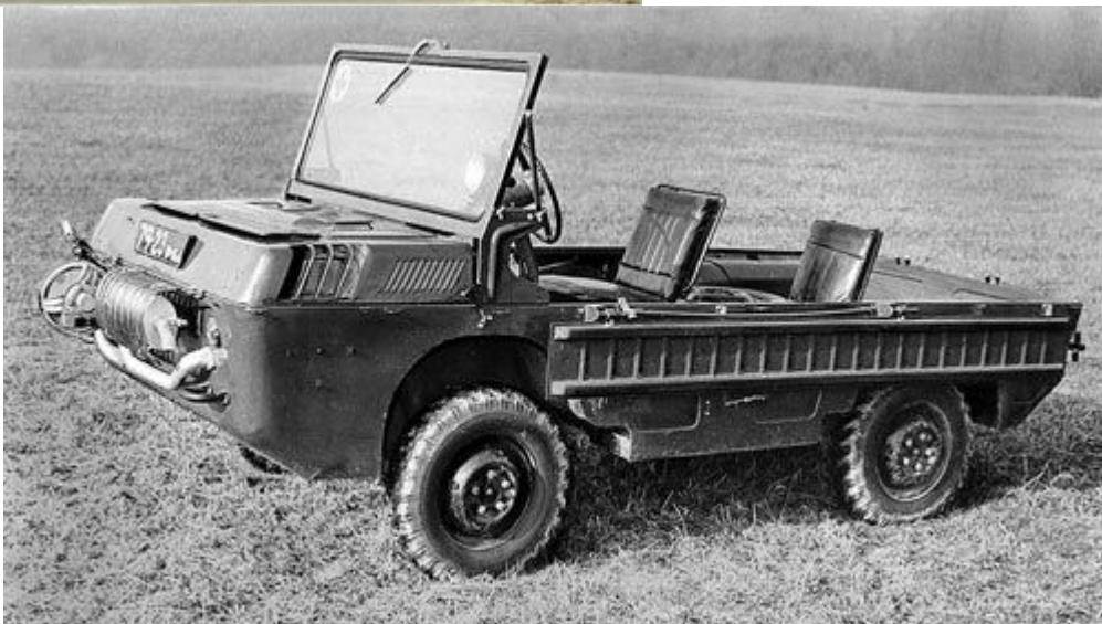
LuAZ 967, SSSR 1965