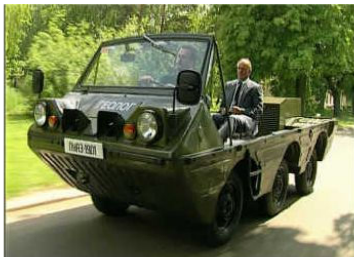
LuAZ 1901 Geolog, SSSR 1999

Model Luaz 969 A byl vyráběn v letech 1975 až 1979. Volin dostal v roce 1975 větší a výkonnější motor. Snímek byl pořízen na jaře 1980 v Kyjevě, hlavním městě Ukrajiny.