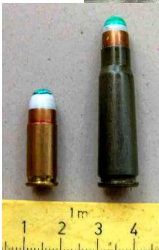
Náboj vľavo je určený pre RPG-75 (Kobilku), náboj vpravo je určený pre RPG-7.